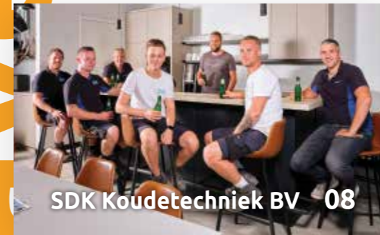
SDK Koudetechniek BV 08